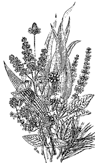
Heilpflanzen im WALA-Garten